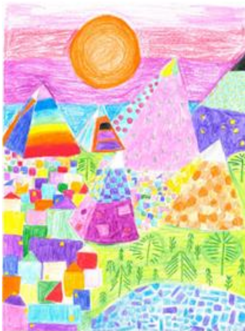
Amélie G. Kausch, „Berge mit See, Wald und Taldörfer“